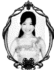
ミミ いけは ゆう 池羽 由 (ソプラノ)